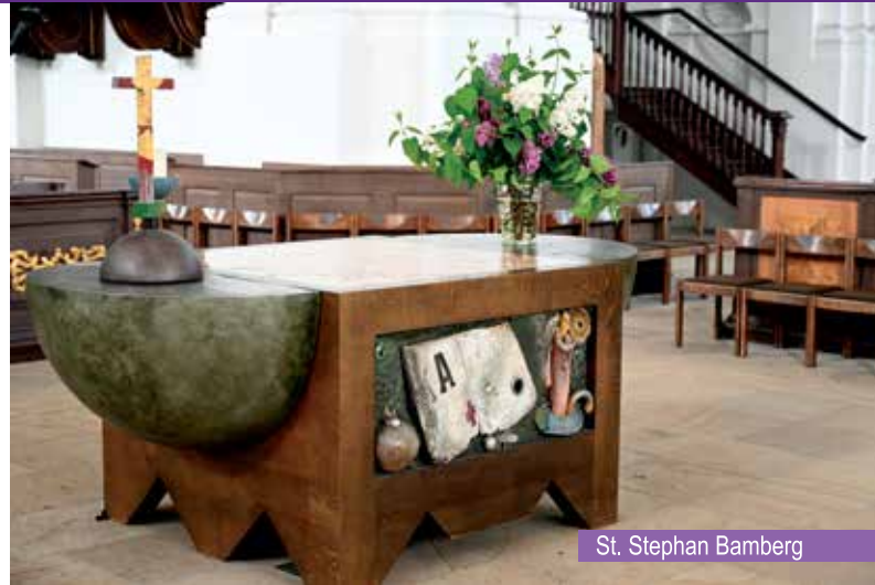
St. Stephan Bamberg