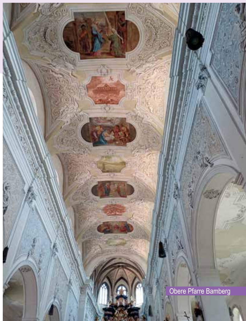
Obere Pfarre Bamberg